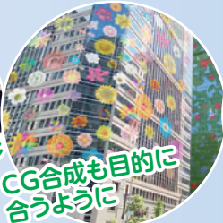
CG合成も目的に合うように