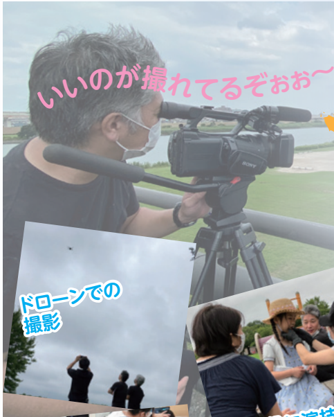
ドローンでの撮影

前職に映像関係の様々な分野で活躍したメンバーがイマジン社員に居ます。彼らが集まって準備チームを構成し、このたびサンプル映像としてイマジンのPRビデオを完成させました。本格的に映像製作業務を開始し、皆様の会社や店舗のプロモーションビデオ、製品紹介ビデオなどを制作していきます。展示会のブースで流すイメージ動画や、YouTubeチャンネル用の撮影・編集作業などもお任せください。まずは、お気軽にご相談を。