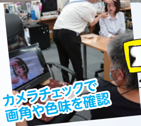
カメラチェックで画角や色味を確認