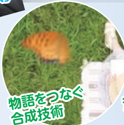
物語をつなぐ合成技術