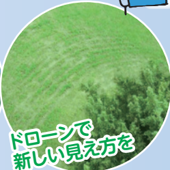
ドローンで新しい見方を