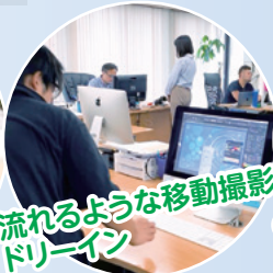
流れるような移動撮影ドローン