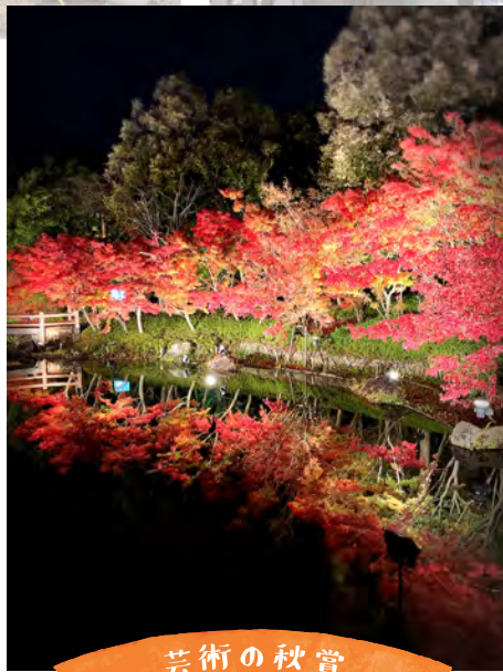
▶暗闇の中でライトアップされた紅葉と水面に映る紅葉、どちらも綺麗で見入ってしまいますね。