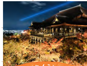
ナイスタイミングで賞