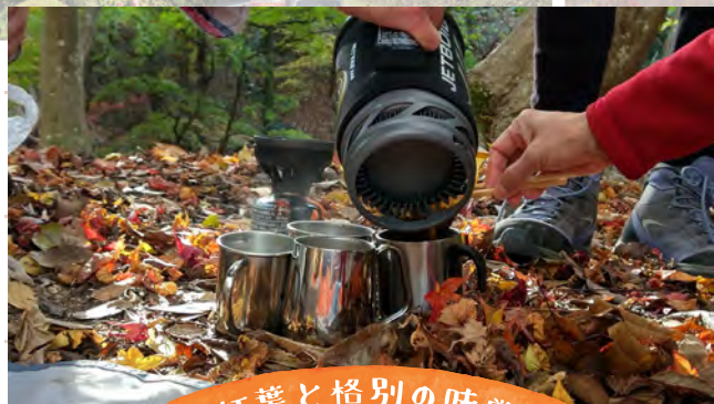
紅葉と格別の味賞